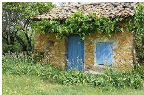
Alice Dumas, Docteur ès lettres

Même le mignon bastidon , comme son synonyme le cabanon , désignant une petite cabane d'habitation rudimentaire, font résonner les barreaux de la prison, car le cabanon était spécifiquement la cellule des criminels récalcitrants puis celle des fous et le parler populaire use toujours de la cabane comme synonyme de prison (du latin, qui signifie ce qui est pris).